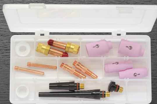
R-18 / R-26