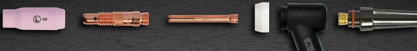
R-18/26 avec corps de pince standard