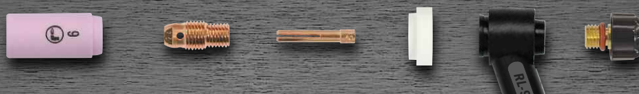
R-9/20 avec corps de pince standard