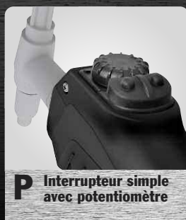
P Interrupteur simple avec potentiomètre