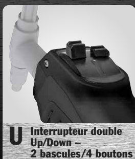
U Interrupteur double Up/Down – 2 bascules/4 boutons