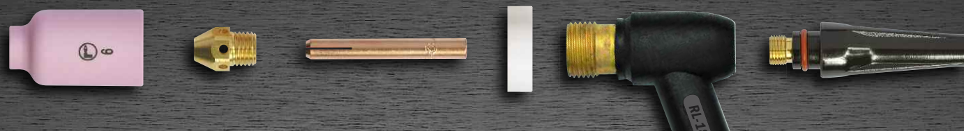
R-18 SC avec corps de pince standard