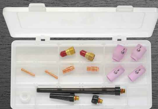
R-9 / R-20