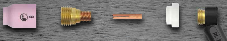
R-24 avec diffuseur de gaz standard